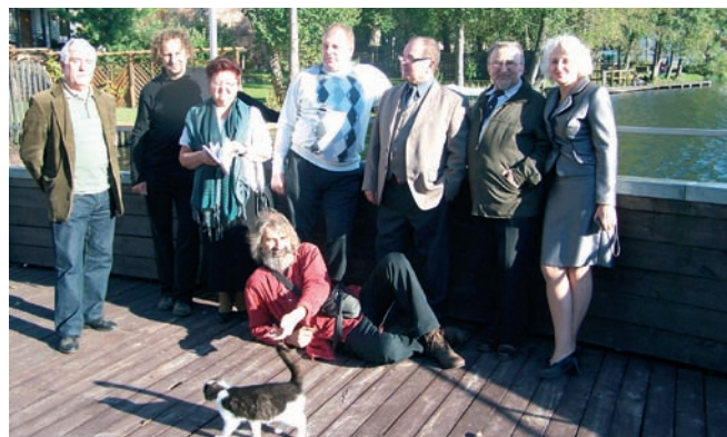
Osobowości z gminy Łągów